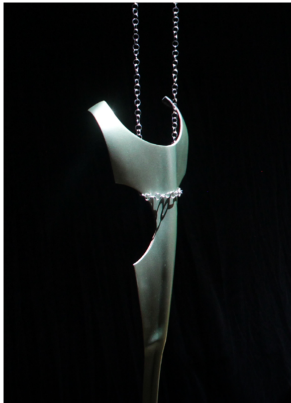
Suska Bastian Protective Shell V (armor), 2022 feuille de palmier, peinture pour voiture 28 x 100 cm © courtesy de l'artiste