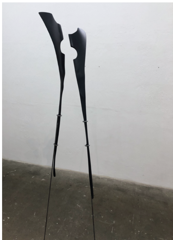
Suska Bastian Protective Shell XII, 2024 feuille, couleur, métal 32 x 98 cm (sans les tiges métalliques)