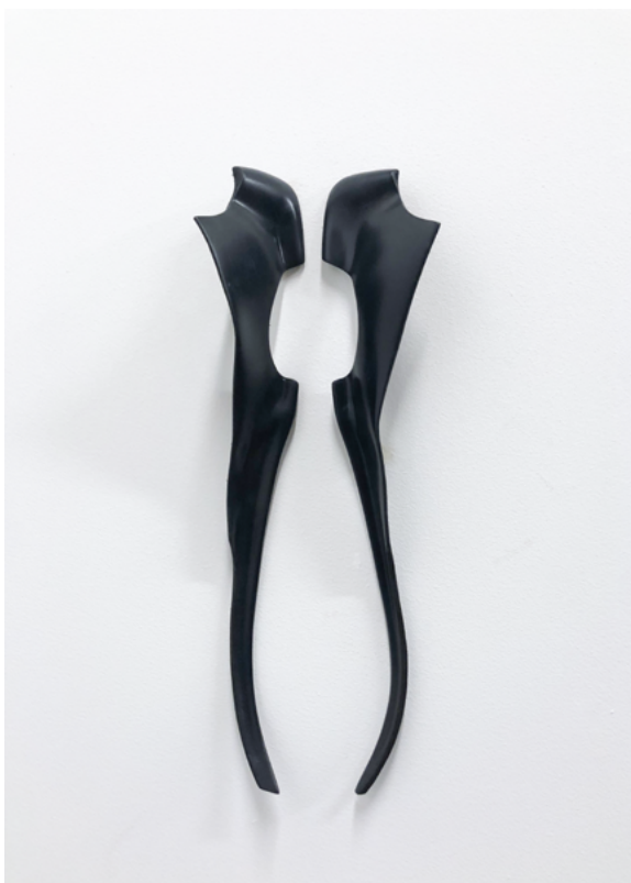
Suska Bastian Protective Shell XII, 2023 feuille, couleur 16 x 38 cm