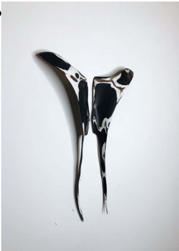
Suska Bastian Protective Shell XI, 2024 feuille 22 x 40 cm © courtesy de l'artiste