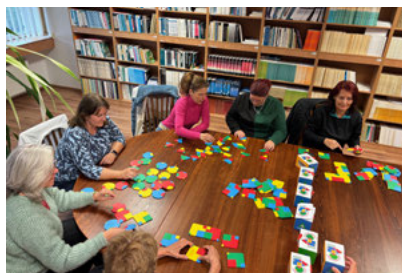
"Meetings and Training Days for Partners" in Eger, Hungary, on October 3rd and 4th, 2024