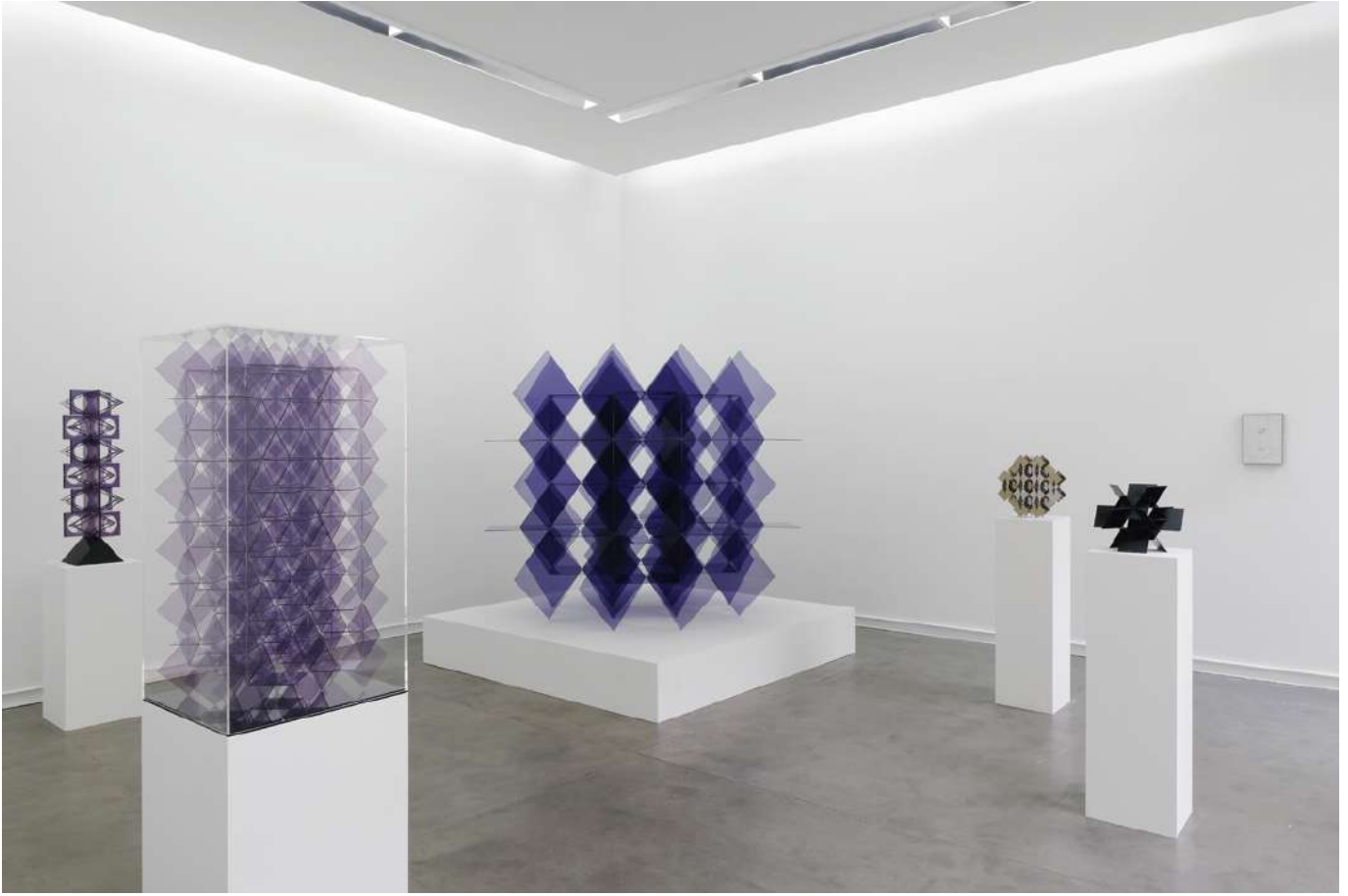
Vue de l'exposition Modus Operandi , Galerie Mitterrand, Paris, 2017 / Exhibition view, Modus Operandi , Galerie Mitterrand, Paris.