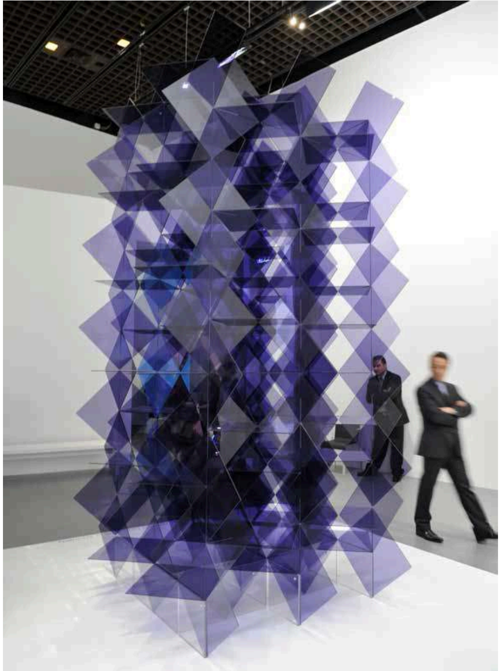
Vue de l'exposition Dynamo , Grand Palais, Paris, 2013 / Exhibition view, Dynamo , Grand Palais, Paris, 2013