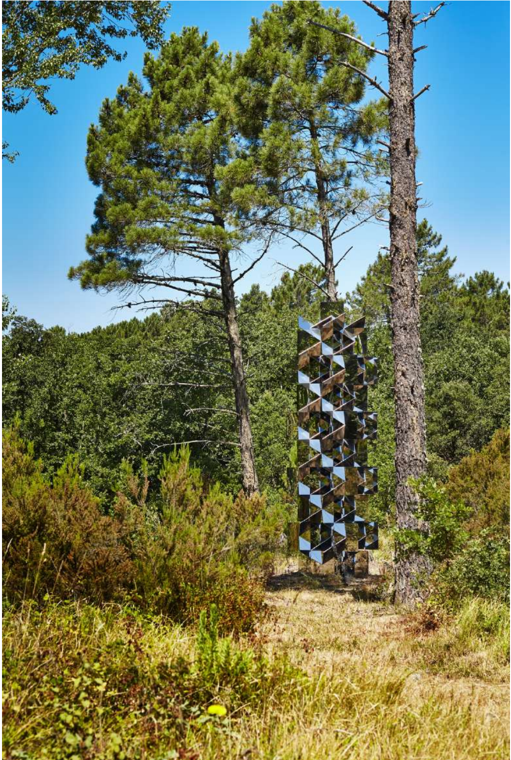
Francisco Sobrino Structure permutationnelle, Acier poli miroir / Mirror-polished stainless steel H 600 x 180 x 180 cm Unique