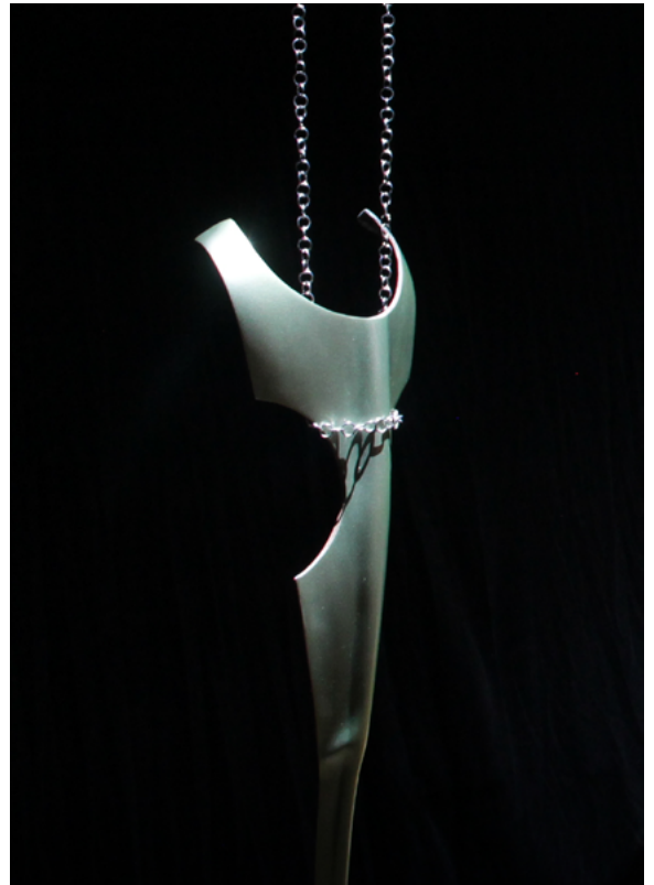
Suska Bastian Protective Shell V (armor), 2022 feuille de palmier, peinture pour voiture 28 x 100 cm