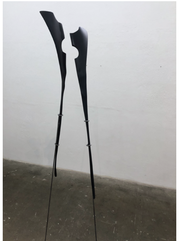
Suska Bastian Protective Shell XII, 2024 feuille, couleur, métal 32 x 98 cm (sans les tiges métalliques) © courtesy de l'artiste