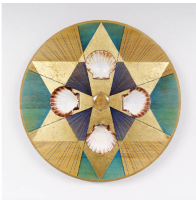
Sandra Lorenzi, Disque talismanique #1 , 2019