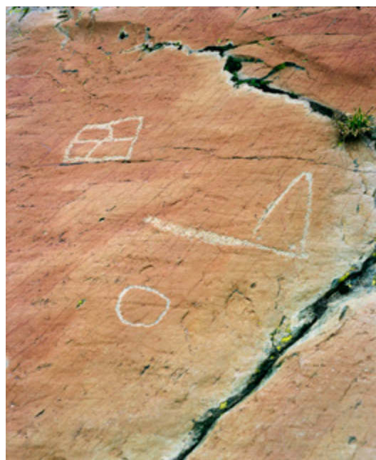
Philippe Durand, Vallée des merveilles 2 , 2016